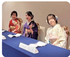
受付対応している幹事

閉会後も名残惜しそうに写真を撮り合う姿が印象的でした。131回生にとって、この再会でできた貴重な時間は、積み重ねてきた日々と変わらないつながりを実感し、かけがえのないひとときとなりました。(木村友香)