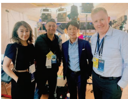
共和党大会取材で同僚たちと

受けることへの憤りもあるという。建国以来7千万人以上の移民を受け入れてきたアメリカだが、移民・外国人排斥は過去にもあった。80年前の日本軍による真珠湾攻撃後、敵国となった「日本の血」を理由に、日本人と日系人12万人が「敵性外国人」として排斥され、強制収容された。「歴史を繰り返してはならない」という思いを新たにしている。