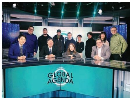
核に関する討論番組の制作陣と

日本も外国人住民が400万人近くとなり、2050年には人口の1割に達する見通しだ。外国にルーツを持ちながら日本を「祖国」とする若い世代も増えている。欧