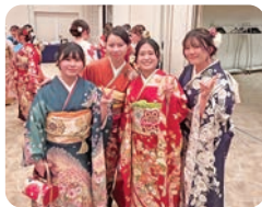
看護学部で共に頑張る仲間