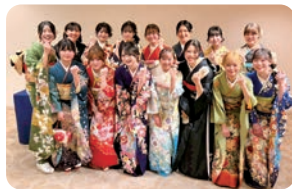
バスケットボール部集合