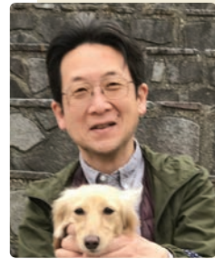
愛犬「くうちゃん」と

キリスト教は「対話の宗教」です。モ―セ五書には自らの判断を後悔する神が、また福音書には民衆の執拗な訴えに態度を改めるイエスが描かれます。その流れの中で成立したキリスト教は、社会との「対話」を通して変化してきました。フレンド派もまた、キリスト教史上類を見ないほど大胆な変化を遂げました。その流れの端に位置する普連土学園も、世の荒波に翻弄されながらもそれに抗い、変化してきました。2022年秋からの刷新作業は、社会の変化に徒に迎合することなく、創立教派が本来持っていた方向性を精確に捉え直し、あるべき学園の姿を目指すものです。 現中学校舎再評価もその動きの一つです。23年夏頃から、法政大学デ